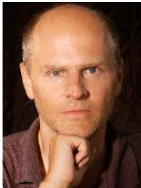
Andreas Reisenbauer (Produktion, Drehbuch)