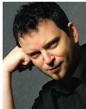
Kawo Reland (Regie, Drehbuch)